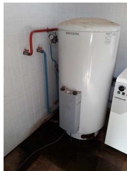
Cilindro MV Videira Modelo E-Renov de 200 litros