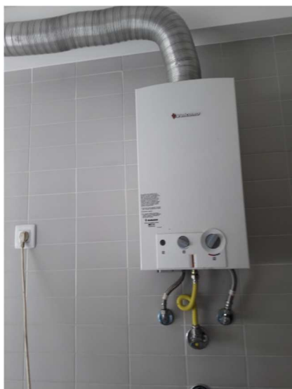
Esquentador a Gás Vulcano