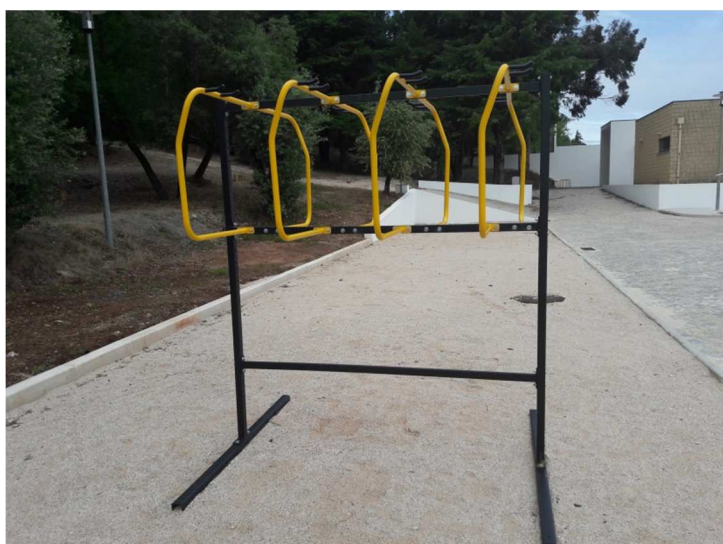
Suporte Exterior de estacionamento de bicicletas da Série SB.PR.99.99.99