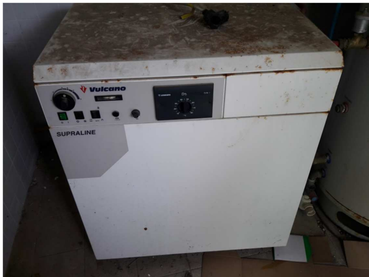
Caldeira a Gás Vulcano Supraline