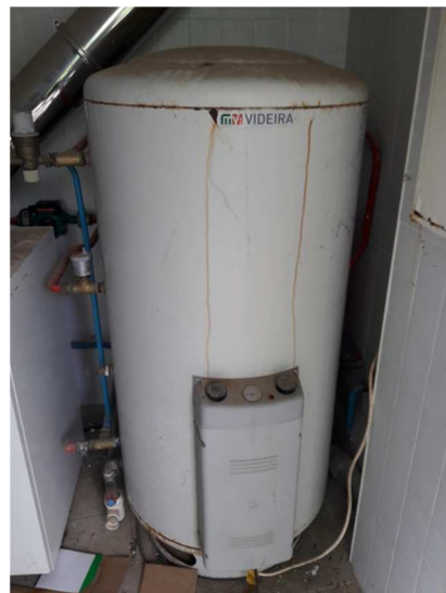
Cilindro MV Videira Modelo E-Renov de 200 litros