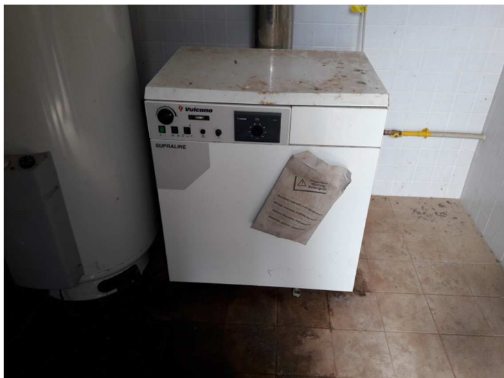
Caldeira a Gás Vulcano Supraline