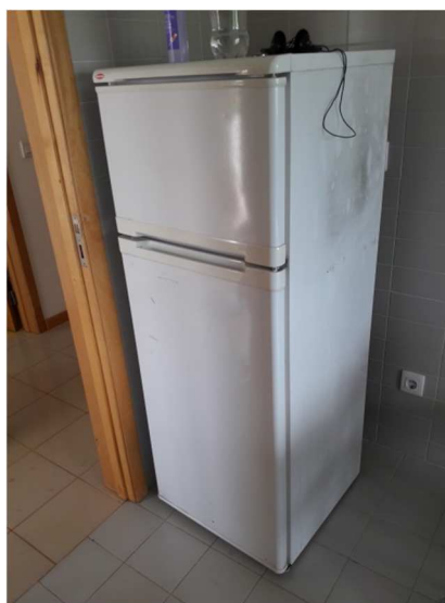
Frigorífico da Marca Becken